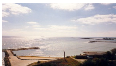
Hotel Paradiso Mangalia